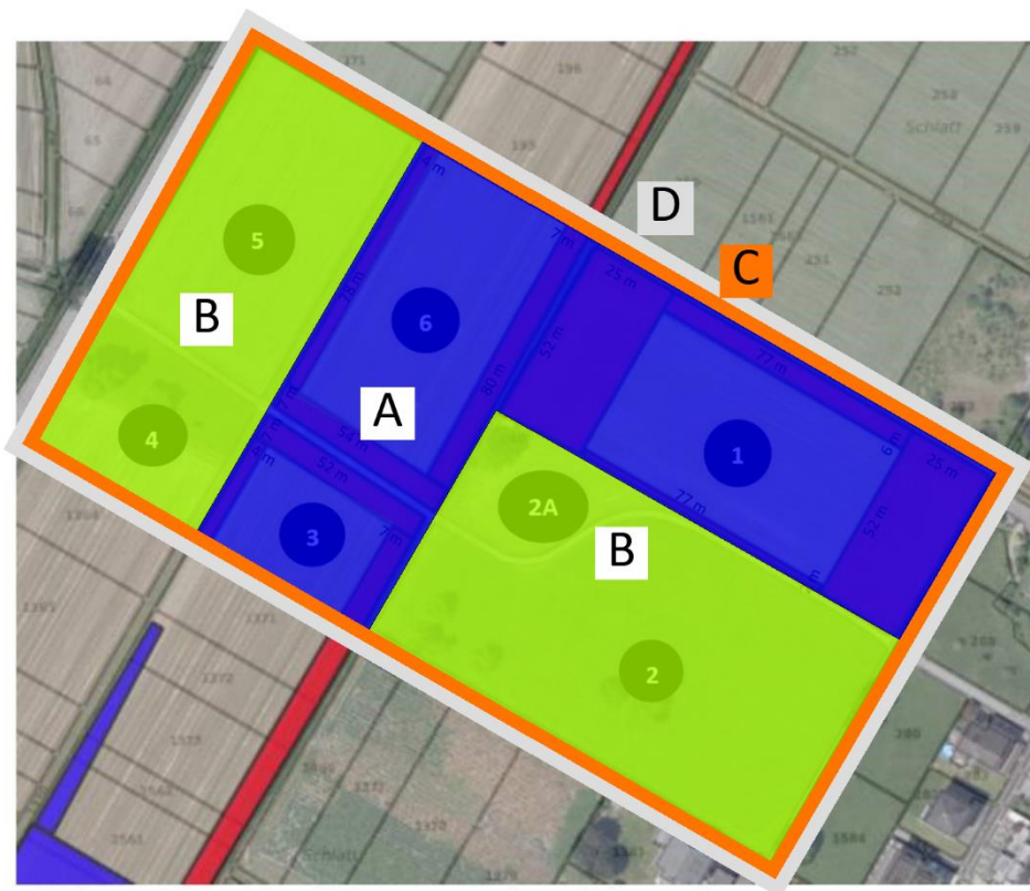
Abbildung 3: Bezeichnung der Aushubarten (Grundriss), Quelle: Eigene Darstellung SSL.