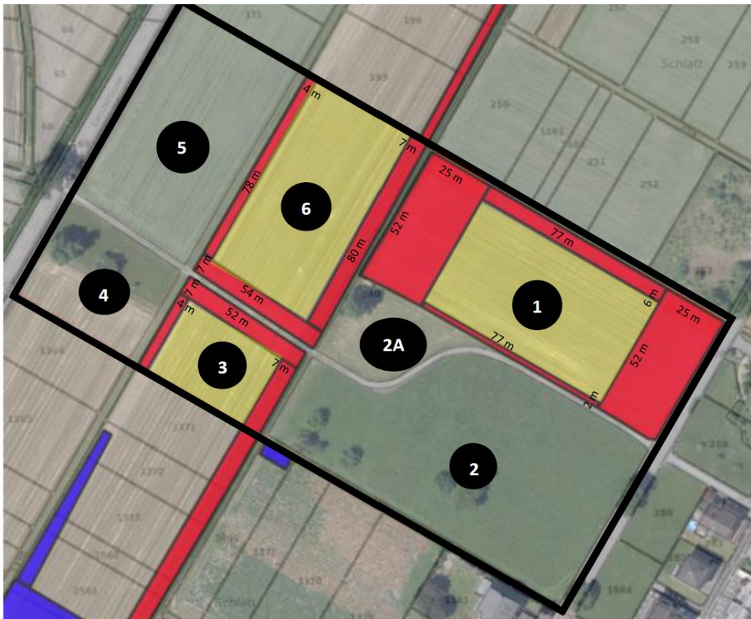
Abbildung 1: Kartierung Grundstück Nr. 240, Ruggell; Quelle: Bericht «Schulzentrum Unterland II (SZU II) / Umsetzung Erdmandelgras» des Amtes für Umwelt.

Zur Unterscheidung der obersten Erdschicht (Oberboden, Oberkante Terrain bis 50cm Tiefe) werden in der nachfolgenden Abbildung Nr. 1 die Flächen mit den Ziffern 2 bis 4 bezeichnet. Die Farben beziehen sich auf den Grad der Ausbreitung des Erdmandelgrases. Rot markierte Flächen zeigen eine wesentliche Ausbreitung von Erdmandelgraspflanzen an, während gelb markierte Flächen das Vorkommen einzelner Erdmandelgraspflanzen oder Nester anzeigen.