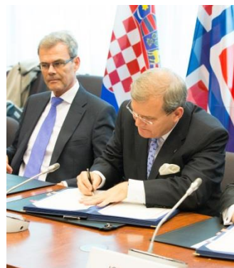
Botschafter Kurt Jäger bei der Unterzeichnung des EWR-Erweiterungsabkommens am 11. April 2014 in Brüssel 6

Am 29. März 2017 unterrichtete das Vereinigte Königreich den Europäischen Rat über seine Absicht, gemäss Artikel 50 EU-Vertrag aus der Europäischen Union auszutreten (Brexit). Das Austrittsabkommen trat am 1. Februar 2020 in Kraft, nachdem es am 17. Oktober 2019 zusammen mit der Politischen Erklärung zur Festlegung des Rahmens für die künftige Partnerschaft zwischen der EU und dem Vereinigten Königreich vereinbart worden war. Mit dem Brexit verlässt das Vereinigte Königreich nicht nur die EU, sondern gleichzeitig auch den EWR.