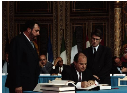
Vertragsunterzeichnung in Porto am 2. Mai 1992 mit damaligem Regierungschef Hans Brunhart 2

Durch den EWR sind die 27 Mitgliedstaaten der Europäischen Union (EU) und die drei EWR/EFTA-Staaten (Liechtenstein, Island und Norwegen) in einem über 452 Millionen Verbrauchern 1 umfassenden Binnenmarkt zusammengeschlossen, in welchem für alle beteiligten Staaten die gleichen Grundregeln gelten. Die Staatsbürger aller 30 EWR-Mitgliedstaaten haben das Recht, vom freien Warenverkehr, freien Personenverkehr, freien Dienstleistungsverkehr und vom freien Kapitalverkehr (die so genannten „4 Grundfreiheiten“) Gebrauch zu machen. Zudem untersagt Artikel 4 EWR-Abkommen jegliche Diskriminierung aus Gründen der Staatsangehörigkeit (Diskriminierungsverbot).