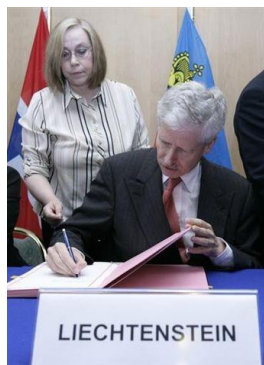
Botschafter S.D. Prinz Nikolaus von Liechtenstein bei der Unterzeichnung des EWR-Erweiterungsabkommens am 25. Juli 2007 in Brüssel 5

Am 1. Mai 2004 wurden Tschechien, Estland, Zypern, Lettland, Litauen, Ungarn, Malta, Polen, Slowenien und die Slowakei, am 1. Januar 2007 Bulgarien und Rumänien und am 1. Juli 2013 Kroatien Mitgliedstaaten der EU und gleichzeitig auch Vertragsstaaten des EWR-Abkommens, da jedes Land, welches der EU beitreten möchte, auch Mitglied des EWR werden muss (Artikel 128 EWR-Abkommen).