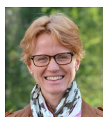
Abteilung Pflichtschule und Kindergarten