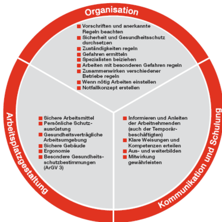
Bild 4 Pflichten des Arbeitgebers.

ArGV 3 ist in Liechtenstein die Verordnung über die Sicherheit und den Gesundheitsschutz der Arbeitnehmer am Arbeitsplatz, LGBl. 1998 Nr. 111