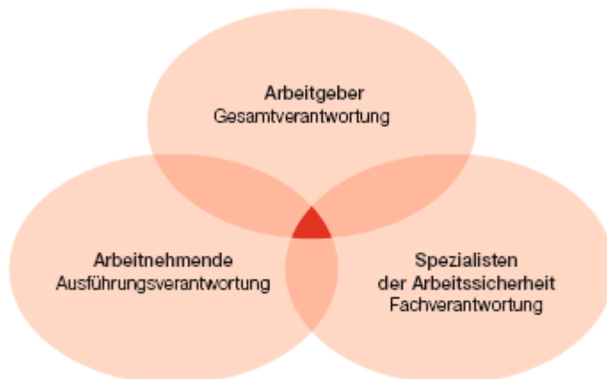
Bild 1 Zusammenwirken von Arbeitgebern, Arbeitnehmenden und Spezialisten der Arbeitssicherheit im Betrieb.

Dieses Merkblatt richtet sich an alle Personen, die in einem Betrieb Verantwortung für die Arbeitssicherheit und den Gesundheitsschutz tragen. Angesprochen sind in erster Linie die Arbeitgeber sowie die Spezialisten und Spezialistinnen der Arbeitssicherheit. Aber auch die Arbeitnehmerinnen und Arbeitnehmer auf jeder Stufe tragen in einem gewissen Mass Verantwortung, wie die nachstehende Grafik veranschaulicht.