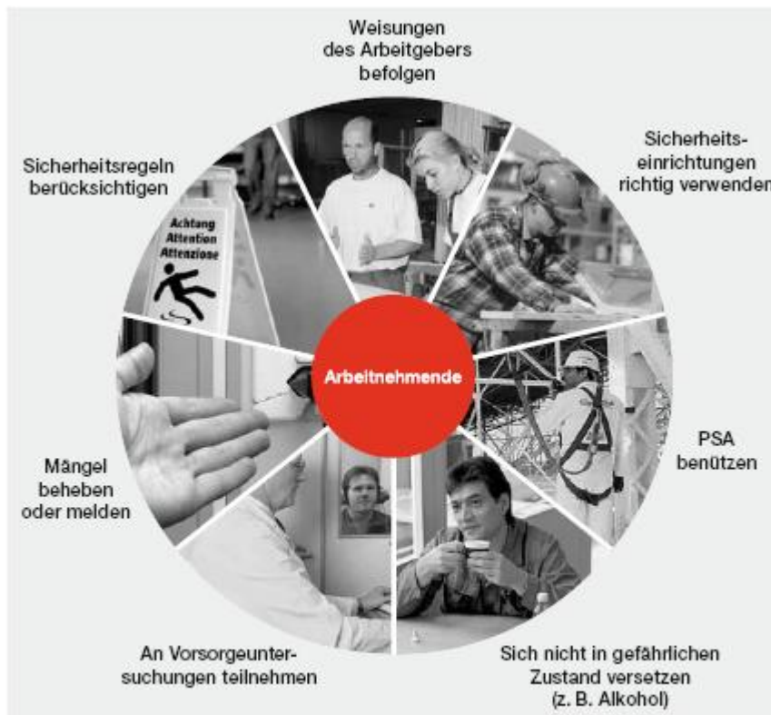
Bild 5 Pflichten der Arbeitnehmenden.