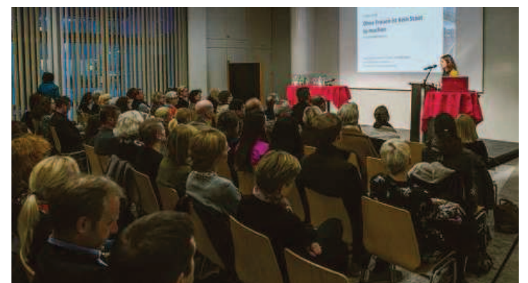
Viele Frauen und einige Männer fanden den Weg nach Vaduz.