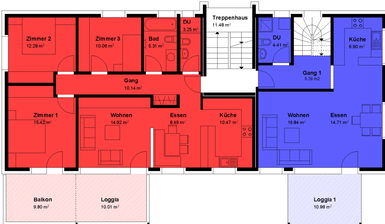
Wohnung 1 4 1/2-Zimmerwohnung

Treppenhaus = 11.48 m 2 Total = 11.48 m 2